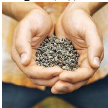
べんきょうのたね 勉強の種

「 分からないこと まちがい 失敗 」は、はずかし くありません。これらは大切な 勉強の種 です。授業 ではこの勉強の種（分からないこと まちがい 失敗）を まいて、みんなで考え、答えをさがしながら、種を育 てていきますと、子どもたちに話しました。